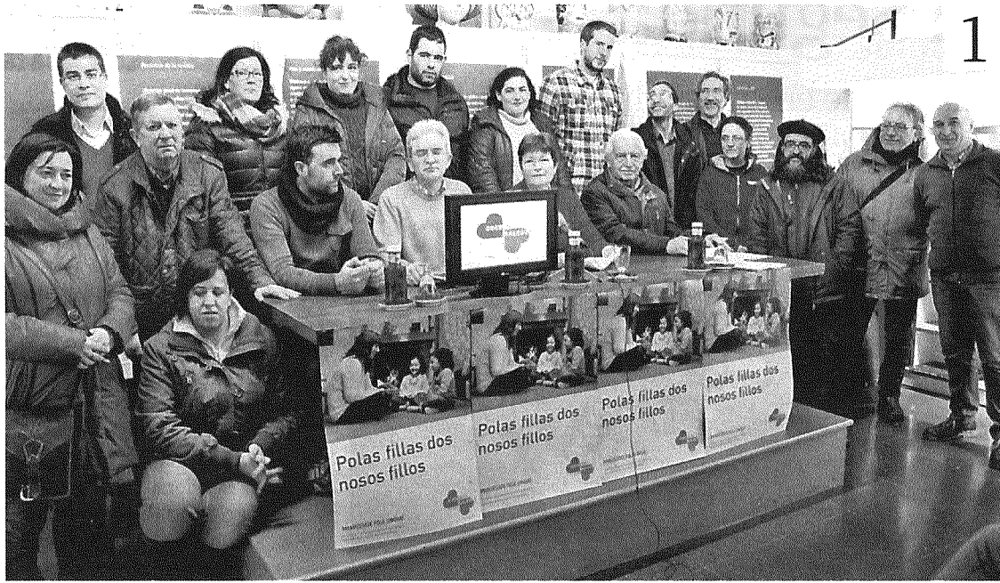
Os colectivos de Lugo integrados en Queremos Galego ofreceron unha rolda de prensa en Sargadelos.

5 En Begonte, investigadores da USC guiaron un acto divulgativo co gallo do Día mundial das Zonas Húmidas con alumnos do CEIP Virxe do Corpiño.