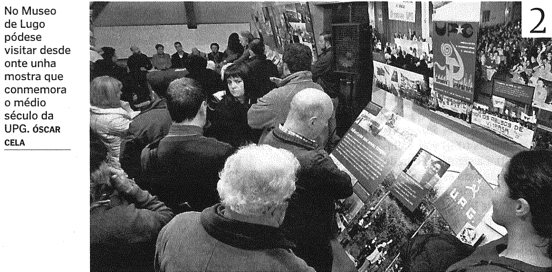
No Museo de Lugo pódese visitar desde onte unha mostra que conmemora o médo século da UPG. ÓSCAR CELA