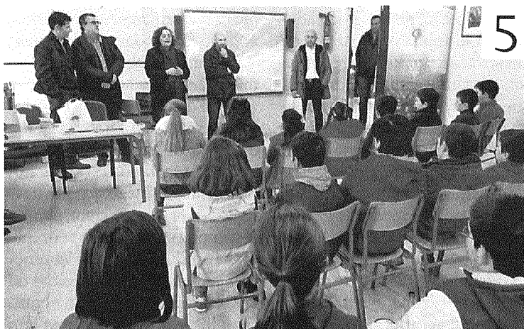
Investigadores da USC, con alumnos do CEIP do Corpiño, en Begonte.