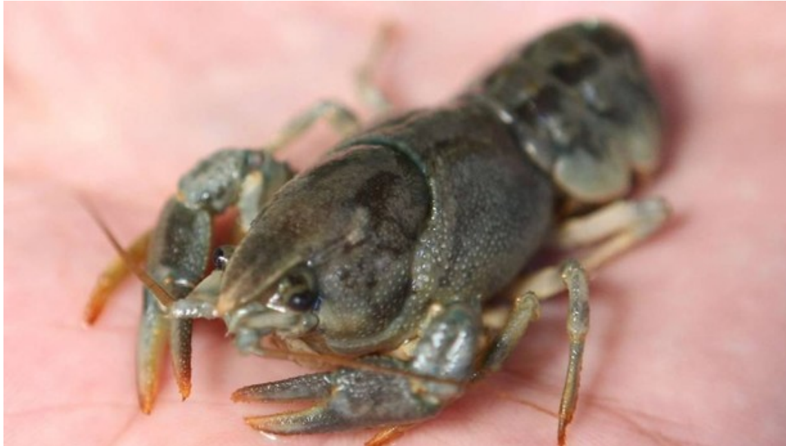
Un cangrejo de río.

Jueves, 29 de Mayo de 2014 - Actualizado a las 05:34h