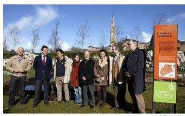
Los participantes en la presentación del proyecto, en el Botánico gijonés.

Quince humedales de la Cornisa Cantábrica serán objeto de conservación a partir del proyecto «Humedales continentales del norte de la Península Ibérica: gestión y restauración de turberas y medios higrófilos», denominado también «Tremedal». El plan fue presentado ayer en el Jardín Botánico gijonés, que también participa en el proyecto, coincidiendo con la celebración del «Día mundial de los humedales».